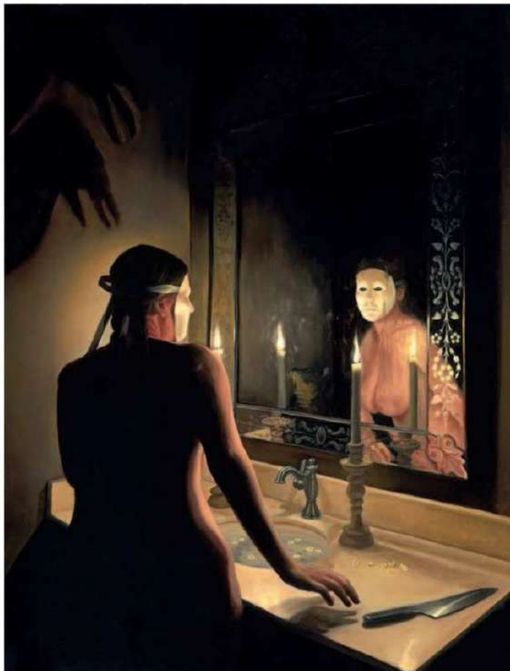
links Jamie Luoto, They Make Us What We Were Not , 2023, Öl auf Leinwand, 71,1 × 53,3 cm