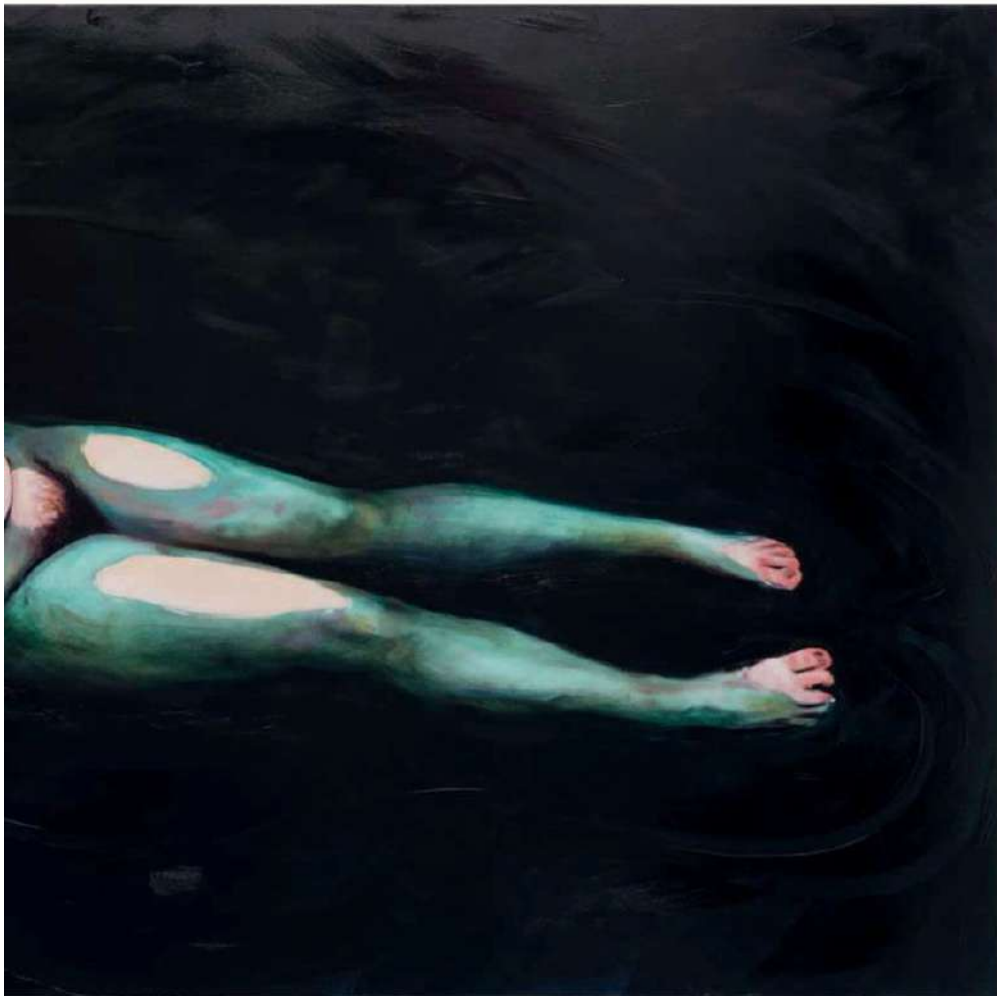
Lydia Pettit, What Lies Beneath , 2023, Öl auf Leinwand, 150 x 300 cm, © die Künstlerin. Courtesy: Galerie Judin, Berlin, Foto: Elliott Mickleburgh