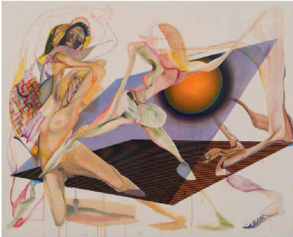
Christina Quarles, In 24 Days The Sun'll Set at 7pm , 2022. Acryl auf Leinwand, 195,6 × 243,8 × 5,1cm, © Christina Quarles, Courtesy: die Künstlerin, Hauser & Wirth, und Pilar Corrias, London, Foto: Fredrik Nilsen

Intime Selbstporträts als Teil einer fortlaufenden Aufarbeitung der eigenen posttraumatischen Belastungsstörung sind ebenfalls das Thema von Jamie Luoto.