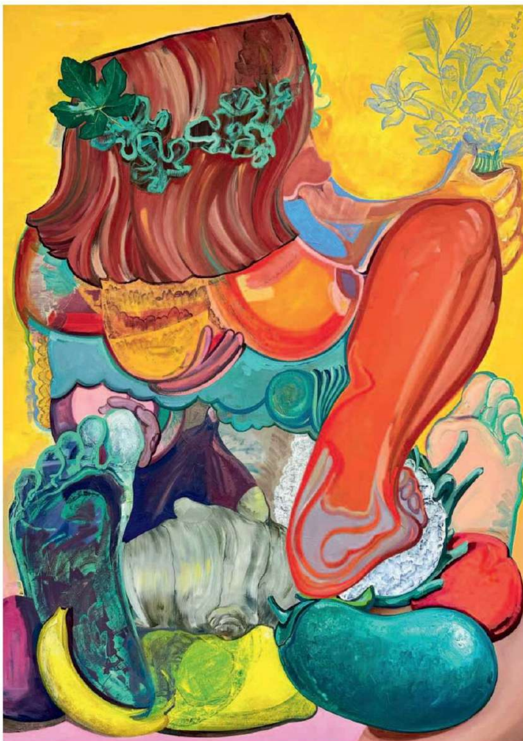
Eglé Otto, Fortuna mit Kurkuma Schenkel , 2024, 210 x 150 cm, Öl auf Leinwand